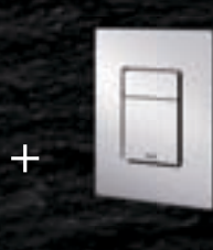
Skate Cosmopolitan 38 732 000